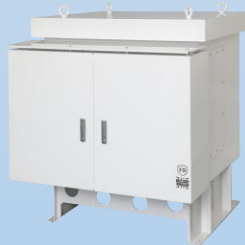
産業用蓄電池 システム向け切替盤 OFGS® series

太陽光エネルギーを無駄なく活用し、発電設備を守る全量自家消費型の太陽光発電用変圧器、PPSC®seriesに新製品PPSC® NEW seriesが登場。新製品を直接見ることができる初めての機会となります。