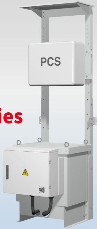
PPSC® NEW series 50kVA